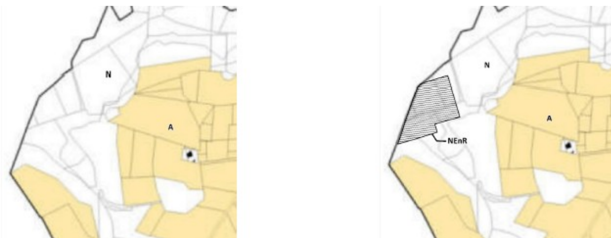
Figure n°2 : à gauche, ancien zonage du PLUi de Sainte-Marie-de-Gosse – à droite, zonage du PLUi de Sainte-Marie-de-Gosse après mise en compatibilité

Les terrains concernés pour l'accueil du parc photovoltaïque sur la commune de Sainte-Marie-de-Gosse sont classés en zone naturelle (N) dans le règlement du PLUi de la communauté de communes de MACS. Les constructions et installations nécessaires aux activités existantes sont autorisées dans cette zone à la condition particulière de ne pas être incompatibles avec l'exercice d'une activité forestière du terrain sur lequel elles sont implantées et qu'elles ne portent pas atteinte à la sauvegarde des espaces naturels et des paysages.