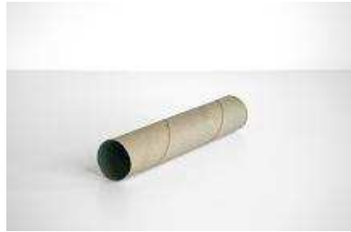
Tube en carton